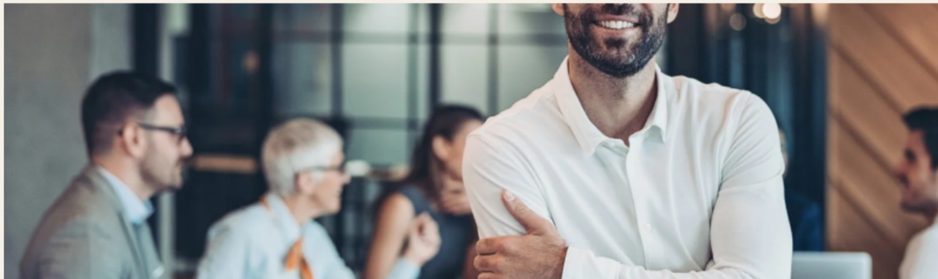
Quinze dirigeants, un même secteur, trois jours.

HIERODEIIS réunit quinze dirigeants d'un même secteur pendant trois jours. Ensemble, ils identifient les usages de l'IA qui comptent pour leur marché et construisent leur feuille de route.