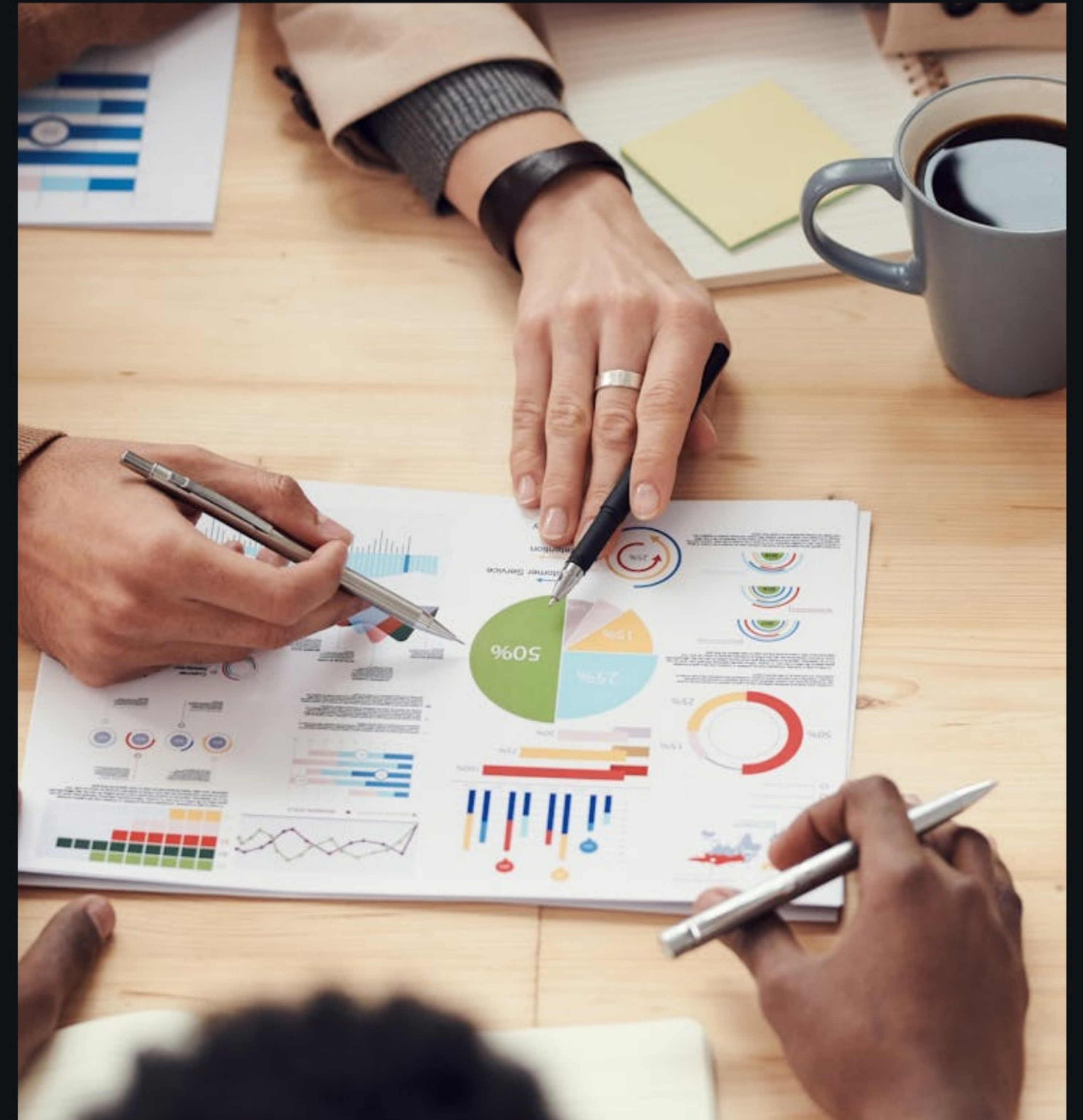
Un cercle de pairs qui dure au-delà des trois jours.

Chaque participant repart avec des contacts qui comprennent son marché de l'intérieur — une ressource qui se prolonge dans le temps et qui n'a pas de prix sur une fiche de formation.