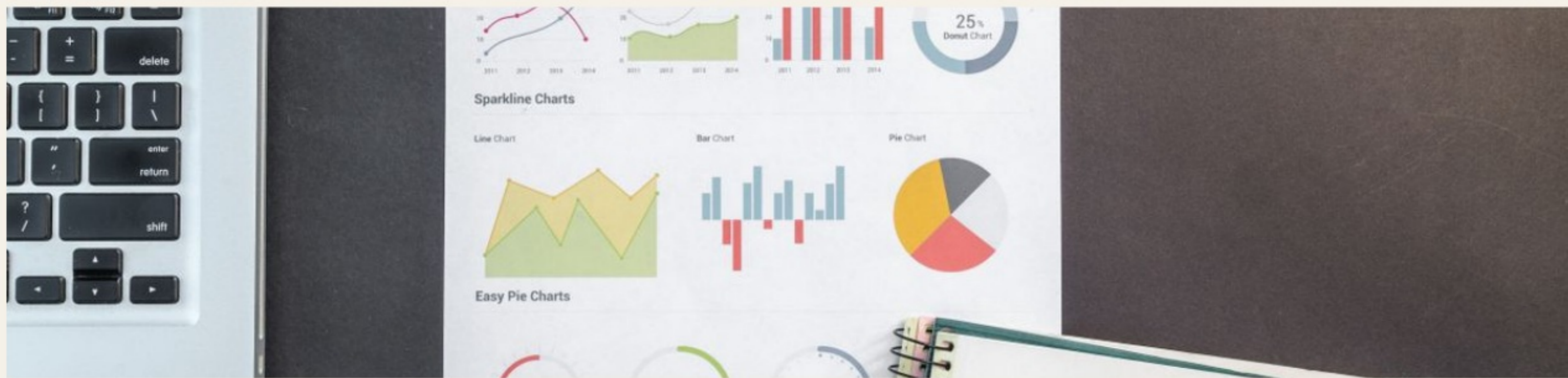
Une feuille de route, pas un compte rendu.

Chaque dirigeant clôture la masterclass avec des livrables exploitables sous 10 jours, pas avec des concepts à digérer.